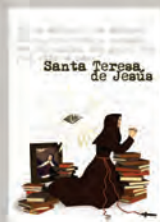
Figura reconocida desde hace mucho tiempo.