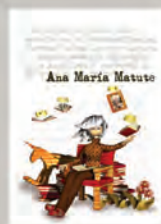
Imagen muy característica y reconocible.