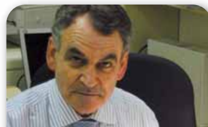
Adolfo Abejón Portavoz de Educación del Grupo Popular en el Senado

3 No encuentro aspectos en los que esté en desacuerdo con las medidas propuestas. No obstante, considero que podrían ser más ambiciosas en la etapa de la Educación Primaria, ampliando, por ejemplo, los programas de refuerzo de las competencias básicas al primer curso de la etapa.