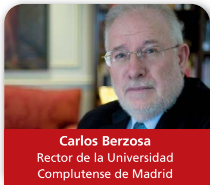
Carlos Berzosa Rector de la Universidad Complutense de Madrid

Que la apuesta por la calidad no sea un ejercicio de burocratizar la escuela a través de los protocolos y rutinas a seguir, al contrario, debe impulsarla a centrarse más en el alumno, a tener en cuenta sus diferencias y a canalizar todos los recursos para que logre el éxito, sin exclusiones y facilitando el acceso a todos. Para ello se requiere una financiación adecuada, de forma que el centro y el profesorado pueda disponer de los medios necesarios para propiciar una buena educación.