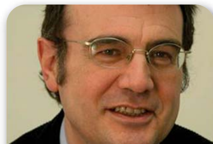
Francesc Colomé Secretario General de Políticas Educativas de Cataluña

Asimismo, el Ministerio no aclara si está dispuesto a impulsar una Ley Orgánica de Medidas Urgentes para la cohesión y la calidad del sistema educativo, que incluya todas las reformas necesarias para dar cumplimiento a los contenidos y objetivos que recoja el Pacto.