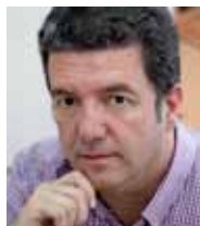
Francisco García Secretario General FE CCOO

EL CURSO 2012-2013 ha terminado como empezó: con la comunidad educativa en la calle denunciando las políticas de recortes del gobierno del PP y reivindicando que otra reforma educativa es posible y, sobre todo, necesaria. La LOMCE no convence a nadie. La soledad parlamentaria y social del ministro de Educación se ha hecho patente en cada momento del curso político. La reforma educativa no responde a los problemas que en la actualidad tiene el sistema educativo español y es reflejo de la agenda educativa de la derecha más conservadora convertida en proyecto de ley.