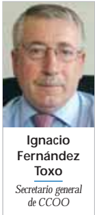
Ignacio Fernández Toxo Secretario general de CCOO