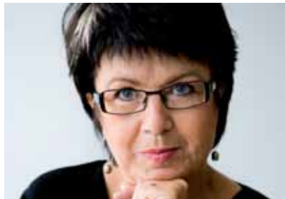
Eva-Lis Sirén/ Presidenta del Lärarförbundet (Suecia)

El próximo año escolar será un momento importante de esta disputa, con una huelga interprofesional en defensa del empleo, los salarios y las pensiones. Un plan de acción, con la participación de todos los actores del mundo de la educación también está en estudio. Finalmente, por supuesto vamos a participar en el Día Europeo de acción que ha convocado la CES.