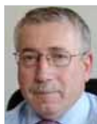
Ignacio Fernández Toxo Secretario general de CCOO