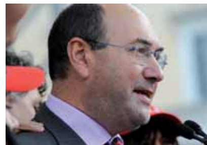
Sébastien Sühr/ Secretario general de SNUipp (Francia)

El programa de estabilidad presentado a la UE prevé una reducción considerable en la contratación de profesores, tanto en la Primaria y la Educación Secundaria (en el profesorado estable se redujo de 6.000 hasta 3.000 y el profesorado subalterno de 11.000 a menos de 4.000).