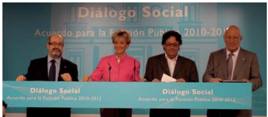
La vicepresidenta primera del Gobierno, M a Teresa Fernández de la Vega, con los responsables de los sindicatos que firmaron en La Moncloa el Acuerdo para la Función Pública 2010-2012.

El texto pactado supone igualmente un importante impulso a la modernización de las administraciones públicas, conteniendo medidas concretas para el desarrollo del EBEP y establece la necesidad de adoptar criterios generales de carrera, evaluación al desempeño, estructura retributiva, etc.