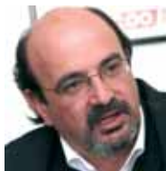
José Campos Trujillo Secretario General FE CCOO

ESTAMOS ante una primavera caliente en todos los sectores de la educación, marcada por la movilización social y laboral contra la reconversión brutal de la enseñanza pública emprendida por el Gobierno del PP. Además de numerosas concentraciones ante el Ministerio y las consejerías de Educación, tuvieron un seguimiento masivo las movilizaciones del 29 de abril y las jornadas de lucha del día 10 de mayo y de luto por la educación del día 17. A estas movilizaciones seguirán otras que iremos convocando.